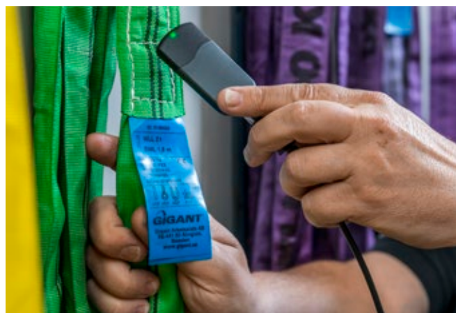
Med en insydd RFID-tag som scannas går det snabbt och enkelt att se om en rundsling är säker att använda.