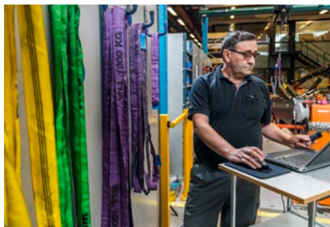
Via Gigant Inspector registreras varje rundsling i en databas online – snabbt, enkelt och framförallt säkert.